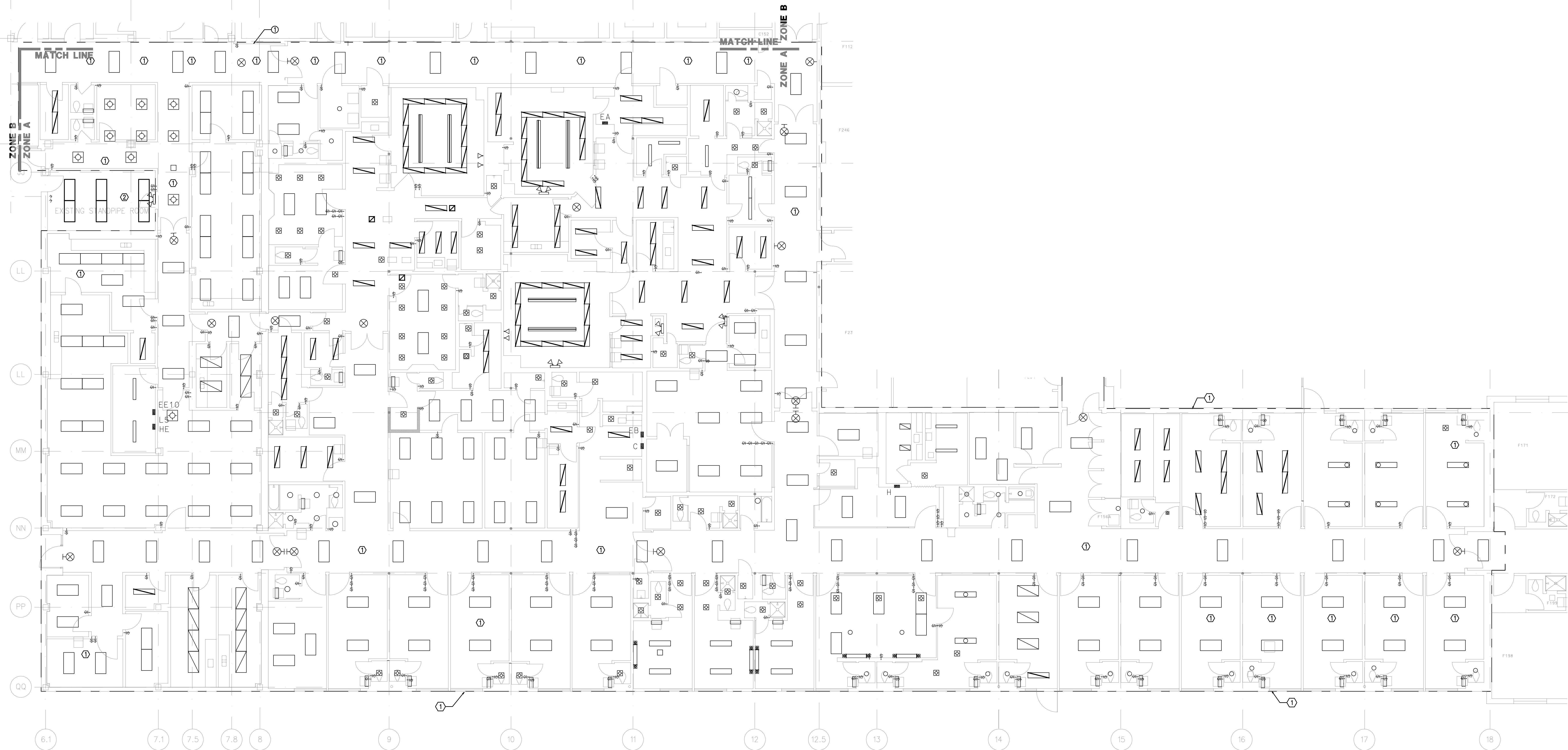
1 ZONE A PLAN

SHEET REFERENCE NUMBER: E0.11 SHEET X OF XX